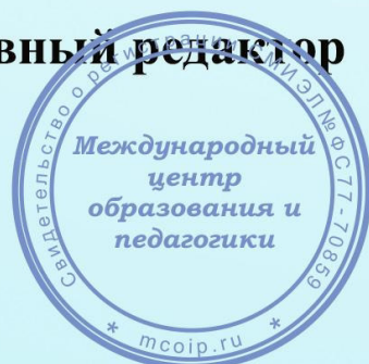
Ирина Гурина 25 марта 2020г.

Международный центр образования и педагогики свидетельство о регистрации СМИ ЭЛ № ФС 77 - 70859 выдано Федеральной службой по надзору в сфере связи, информационных технологий и массовых коммуникаций