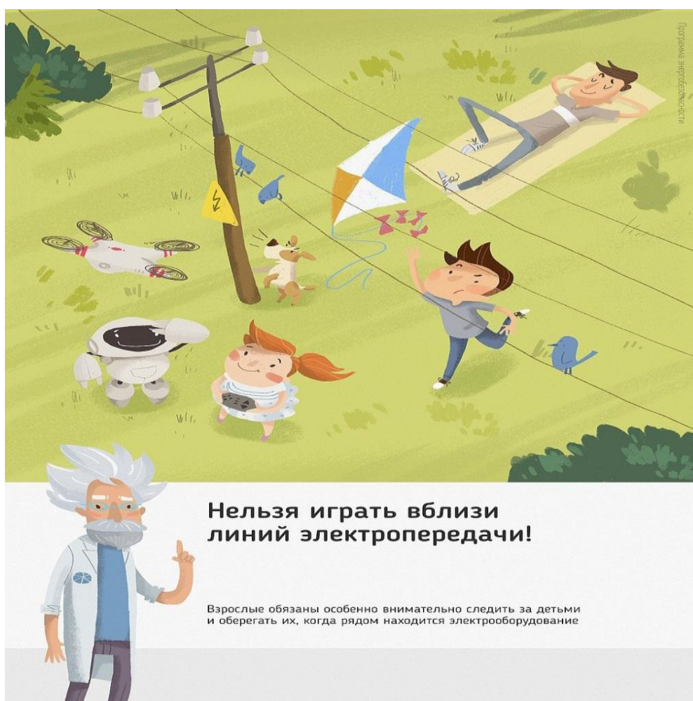
Рис.3 Нельзя играть вблизи линий электропередачи