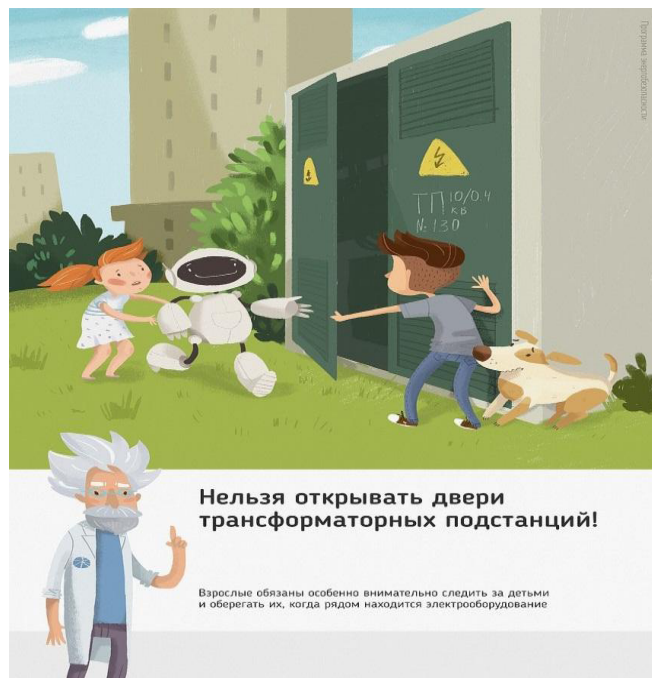
Рис.1 Нельзя открывать двери трансформаторных подстанций

Ежегодно энергетики проводят для школьников познавательные уроки, конкурсы рисунков и историй на тему электричества и правильного с ним обращения. Но работы одних энергетиков в данном направлении недостаточно, для полного понимания проблем электробезопасности нужен пример общества, в котором растет ребенок, и, конечно же, главным образом родителей. Эта работа приносит свои результаты: электротравмы на энергетических объектах единичные, и каждый случай становится поводом для служебной проверки. Но только технических мер мало для того, чтобы полностью обезопасить детей. Им нужен пример родителей.