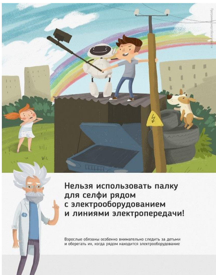
Рис 2. Нельзя использовать палку для селфи рядом с электрооборудованием и линиями электропередачи

Ну и, наконец, нужно повторить с ребенком алгоритм действий в экстремальной ситуации. Проверьте, умеет ли он набирать на сотовом телефоне телефон экстренных служб. Изучите с ним вещества и предметы, которые хорошо проводят электрический ток и потому особенно опасны, и, наоборот, вещества и предметы, плохо проводящие электрический ток и полезные в экстремальной ситуации.